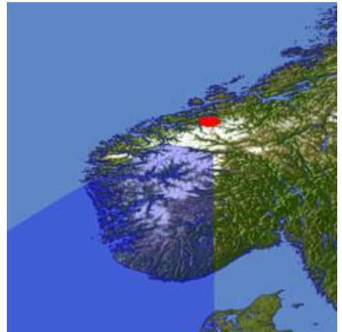
Jotunheimens placering i Norge

Fra den 24. juni til den 4 juli 2011 tog Frydenborgs trop på vandretur til Jotunheimen i Norge. Afsted tog 6 spejdere og 3 ledere. Spejderne nærende ikke noget ypperligt ønske om at skrive dagbog, ej heller gjorde 2/3 dele af lederne, så dagbogen er skrevet af Jakob som syntes det er en besværlig, men trods alt god måde, at få nogle af de ting med fra turen som fotos ikke kan beskrive. Også selvom et foto kan fortælle mere end tusinde ord... Derfor er dagbogen også beskrevet ud fra hvad der er set ud fra Jakobs øjne, og der kan være ting som slet ikke er med, om end de kan have haft stor betydning for spejderne.