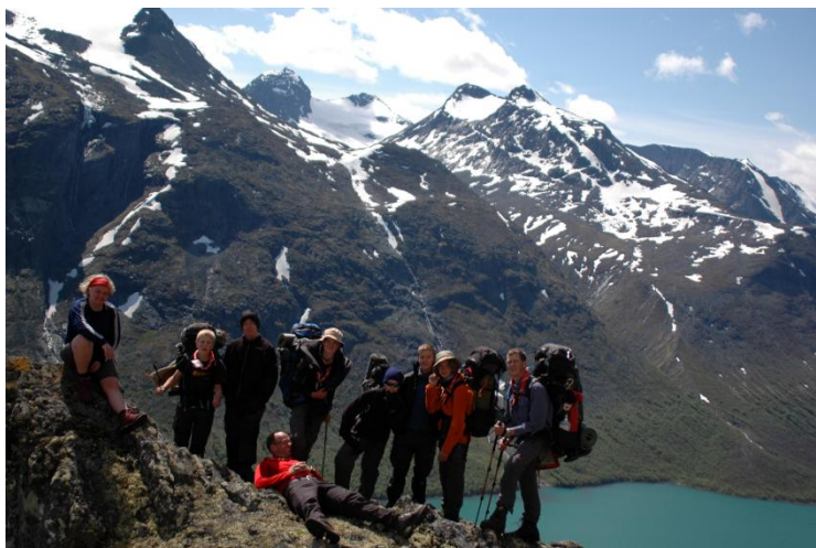
Gruebillede på kanten