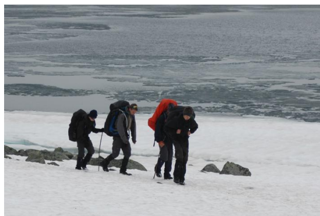
Vandring i sne, parallelt med den frosne sø Troget