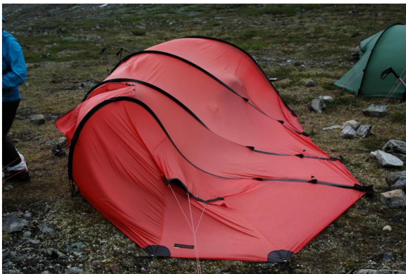
Vinden var hård, især lederens røde telt var maksimalt presset af vinden

Stormvejret og regnen gjorde at alle lavede morgenmad i teltene.