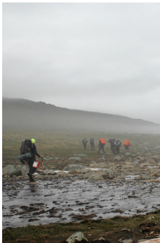
På vandring i vand og lave skyer

9:40 gik vi. Stien var god og farten var ligeså! Spejderne spurtede af sted, det gik jævnt nedad. Vejret så godt ud med små huller til blå himmel – og mulighed for at se lidt bjergsider. Men selvfølgelig blev det snart skyet og gråt igen! Godt vi havde fået nogle flotte bjerge at se i starten af turen!