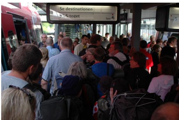
Togkaos på Svanemøllen. Bjergrøjen kan lige anes i midten.

Klokken var 02 da bussen gjorde holdt i Göteborg i Sverige. Vi var kommet igennem tolden uden kontrol og det var tid til at strække ben. Det vrimlede med heavy rockere efter en stor metalkoncert. De både vadede rundt og lå og sov på jorden. Efter en halv times tid kørte vi igen og klokken 06:30 ankom til København som planlagt. Hvad der ikke var planlagt var at der havde været skybrud i weekenden og togtrafikken derfor var lammet.