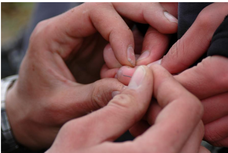
Behandling af en vavel - ikke engang den blev nævnt ved tuderunden