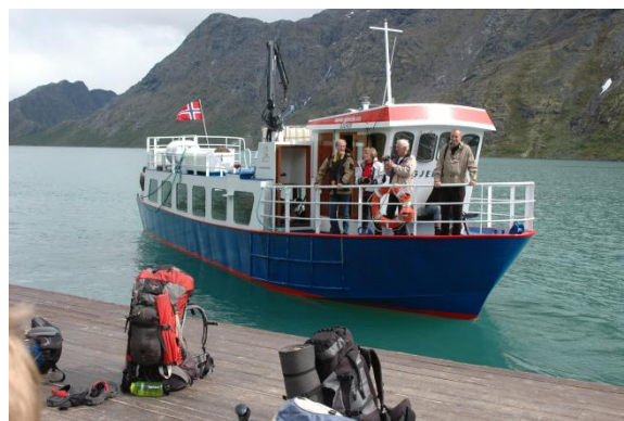
Gjende III, båden der bragte os til Memurubu

Efter 35 minutters sejlads med flot udsigt gik vi i land ved Memurubu, 1008 MOH. Ved turisthytten i Memurubu fik vi fyldt vand på vores drikkesystemer og vandflasker og 15:25 kom vi for alvor af sted.