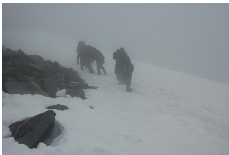
Der blev lagt kræfter i for at komme op. Vejret var absolut dårligt!

Vi kæmpede os videre opad. Vejret var virkeligt dårligt og vinden var meget hård. Rygsækovertrækkene havde vi bedt spejderne om at pakke væk, vinden var simpelthen for kraftig og hellere en våd taske end at blive revet omkuld af vinden. Alle var på nuværende tidspunkt udkørte og våde. Efter endnu et stykke mødte vi en hollænder som netop havde været på toppen og som kunne fortælle os at toppen snart var i sigte og at vi ca. havde 30 minutter endnu. Det var dog nærmere en time, men det var rart at høre.