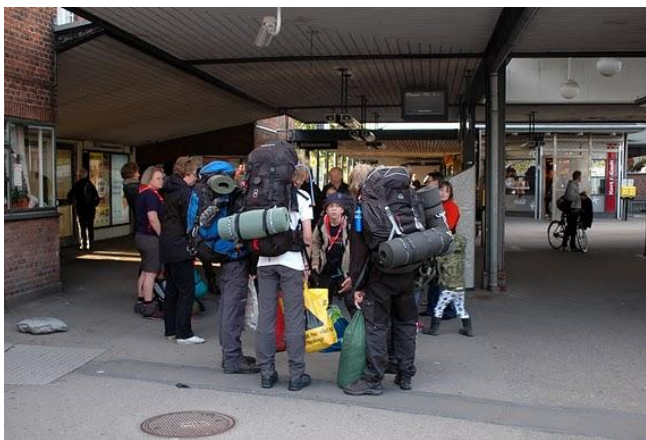
Samling på Hillerød station inden afgang.