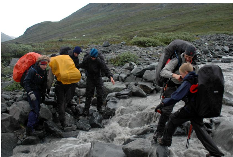
Krydsning af vand kræver samarbejde!

Klokken 11:15 var alt pakket og vi var på vej imod Spiterstulen. Heldigvis havde vi udsigt til en kort dagstur.