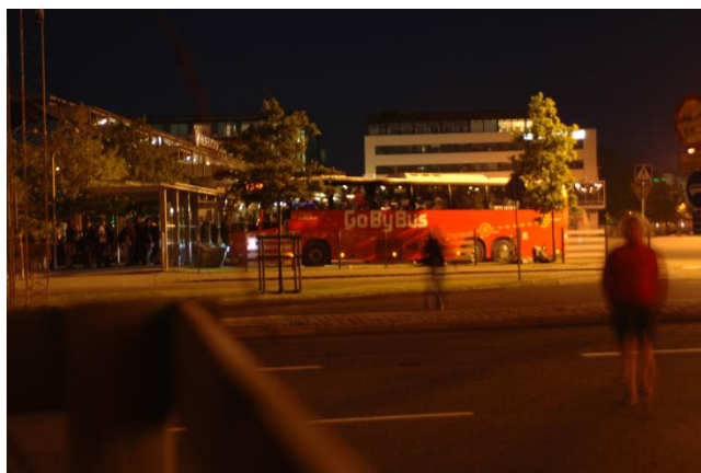
Vores bus til Danmark holder pause i Göteborg

Vi begav os på vej og måtte skifte tog to gange og køre med tre tog. Vi sendte løbende SMS status til forældrene om vores ankomsttidspunkt, efterhånden som det ændrede sig. Vi havde lidt kiks og knækbrød til morgenmad, men afsætningen var ikke den helt store. Folk var vist ved at være trætte af den type kost.