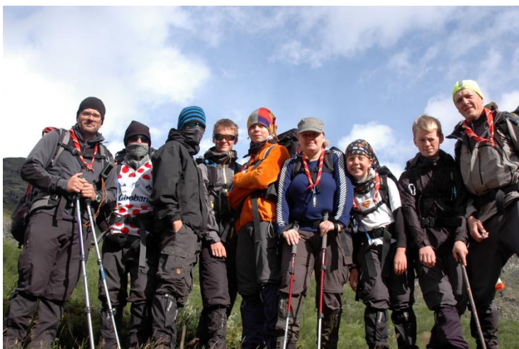
Gruppebillede inden afgang imod Galdhøpiggen

Planen var at vi skulle gå klokken 08:00, hvilket i teorien var muligt da teltene skulle blive stående (basecamp concept) og rygsækkene var prepakket i dagen inden.