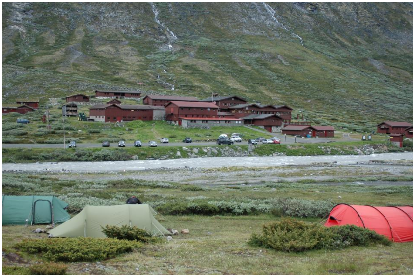
Vores basecamp med Spiterstulen i baggrunden

Vi slog telte op (Basecamp var etableret), spiste frokost i det fri og vejret klarede op. Fantastisk eftermiddag og super rart med lidt ro og afslapning.