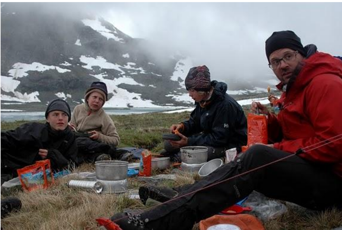
Spisning i det fri - for første gang i flere dage tillod vejret at vi kunne spise fælles aftensmad udenfor.

21:30 var der ro og 22:00 sagde lederne godnat!