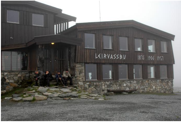
Leirvassbu, turisthytten hvor vi spiste vores frokost

Turen gik videre ad T-ruten...som efter passage af et sneområde blev til L-ruten. Jo længere vi gik, jo højere kom vi op. Vi undrede os lidt og til sidst måtte vi sætte os ned med det detaljerede kort, kompas, GPS og højdemåler og erfare at ruten vi fulgte ikke var indtegnet på kortet. Vi måtte derfor retur og ind på den rigtige rute – som vi havde overset pga. tætte skyer og et bredt sneområde.